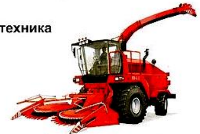
комбайн для уборки зерна

2. Игра «Сложные слова» (образование односложных слов – название специального транспорта).